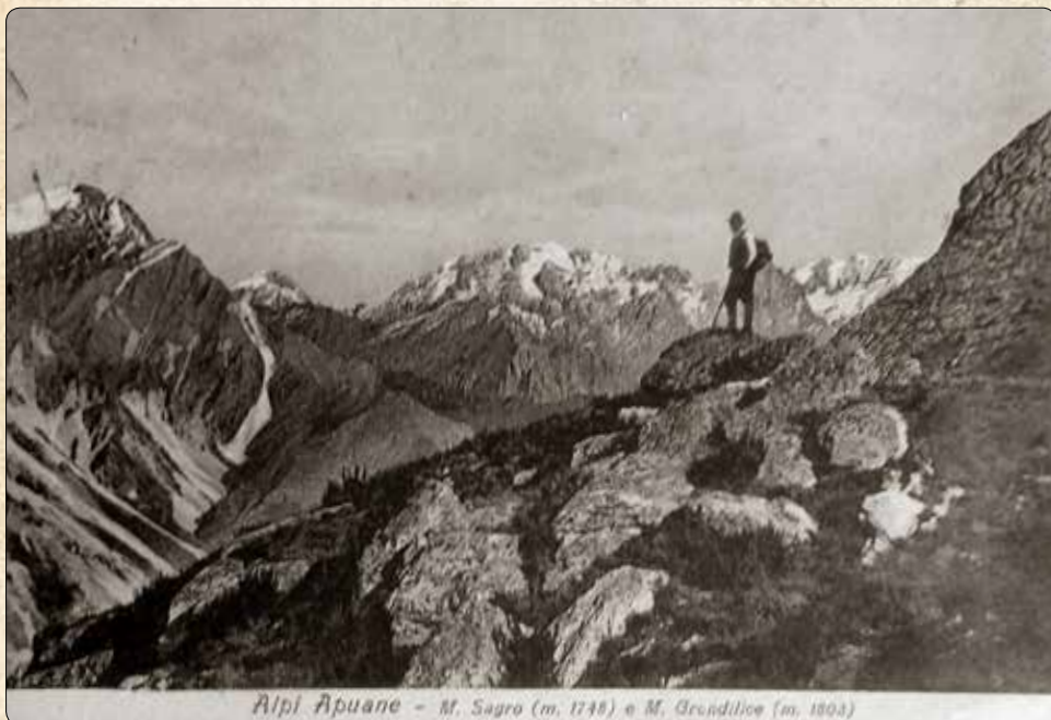
Fotografia da cartolina d'epoca. Massa.

Posto di chiamata permanente Rifugio "CARRARA" loc, Campocecina tel. 0585 841972 CHIAMATE DI SOCCORSO - tel. 118