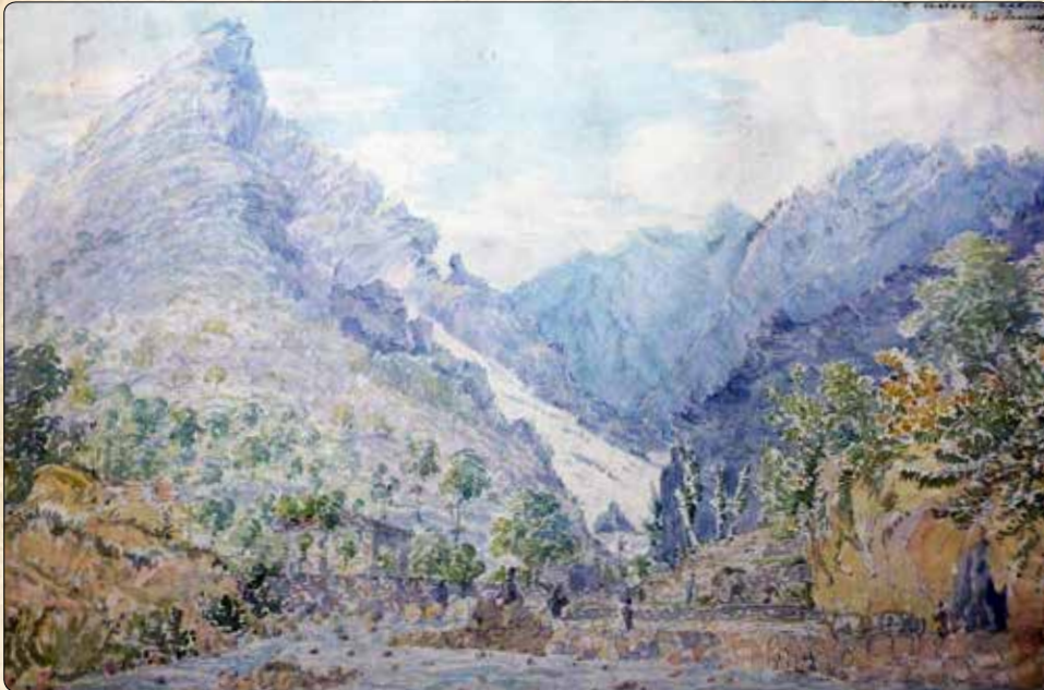
William Paget, Veduta sopra Torano. Acquerello su carta, 1821

La ferrata Gamma 1, è una delle ferrate più conosciute e più praticate delle Prealpi lombarde. Due sono i tratti che la caratterizzano maggiormente: la forte esposizione e il numero di scale che sembrano non finire mai. Tuttavia è una ferrata non difficile, ma comunque d'impegno fisico piuttosto elevato, dovuto al dislivello da superare. Molto interessante dal punto di vista panoramico con magnifica vista sul lago di Lecco, sulle Grigne e sulla pianura Lombarda.