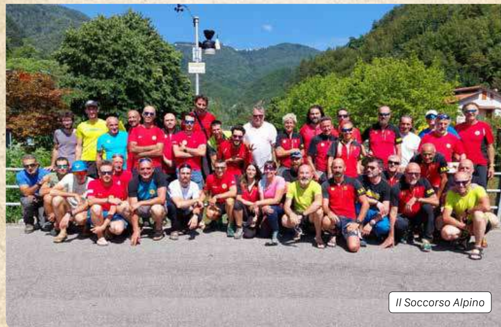
Il Soccorso Alpino