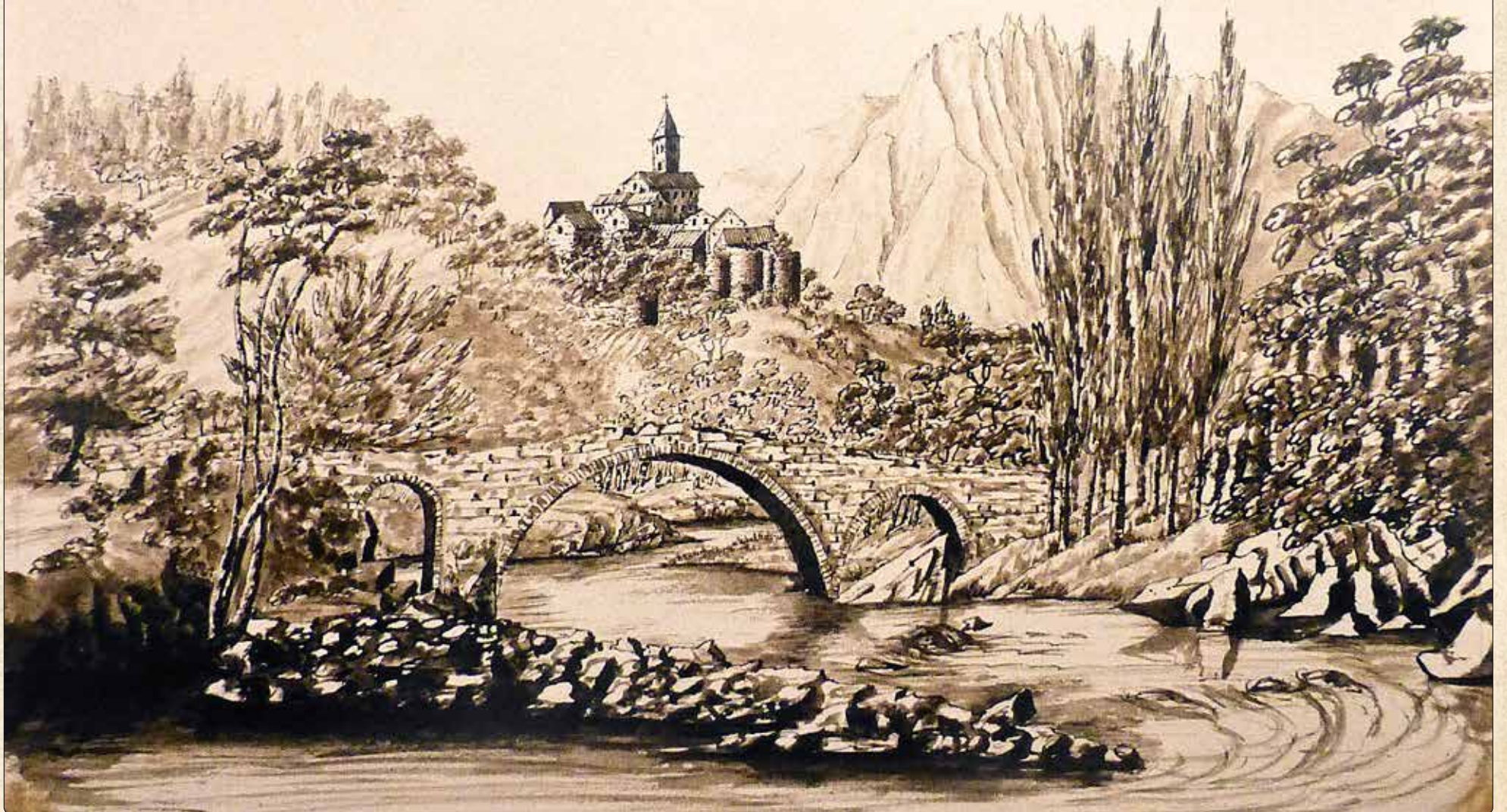
Soliera, 1821. Penna e acquerello su carta, riconducibile al pittore inglese William Strangways

Soliera vista dalla S. Margherita Madonna 1821 Abbatino via quietella