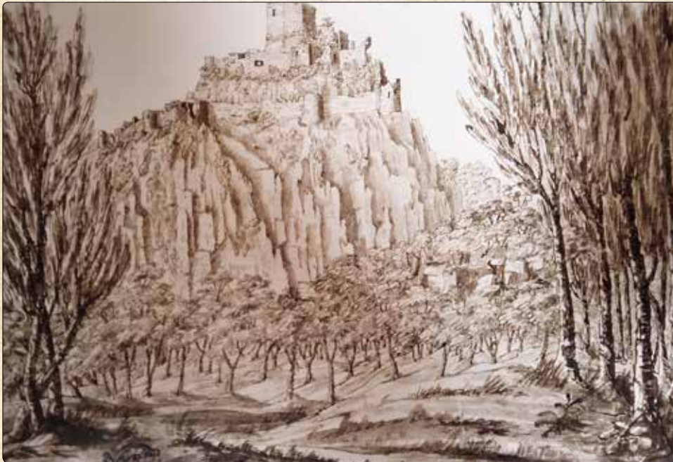
Castello di Montignoso, 1821, Penna e acquerello

Superate le frazioni di Capanne, Prato e Piazza, si prende la strada per la località Vietina, dove parcheggiamo l'auto lungo la riva sinistra del torrente di Montignoso, conosciuto localmente come Tascio. Più avanti, presso i vecchi edifici industriali e capannoni, termina la via di lizza del Tascio, che scende dalle propaggini del monte Carchio. A un bivio (505 m), la via prosegue nel suo tratto più ripido e impegnativo. Sulla sinistra, un sentiero diretto al Passo del Boccalo e al Pasquilio, con percorso non impegnativo, eviterebbe il tratto più scosceso. Proseguiamo, invece, per la via di lizza che adesso è attrezzata con filo di acciaio, in qualche tratto sfilacciato, per cui utili guanti da ferrata per progredire. Inizialmente sono tornanti molto ripidi che evitano un pezzo ripidissimo della via di lizza e aiutano nella progressione insieme alla corda metallica. Raggiunta la base del ravaneto che scende dal monte Carchio si arriva alla strada marmifera, dove termina la lizza. Da qui intercettiamo il sentiero 140 Riomagno-Pasquilio. Siamo alle pendici del Carchio e a destra abbiamo la cresta Carchio-Folgorito. La cresta è percorsa dal Sentiero della Linea Gotica, che percorreremo (possibile anche seguire la strada marmifera) fino al Col di Melo, ai piedi del m.te Folgorito, m.910. Visibile in basso, versante ovest, un sentiero della linea gotica che scende ripido su Vietina e alle auto.